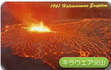
1961 Halemauau Eruption