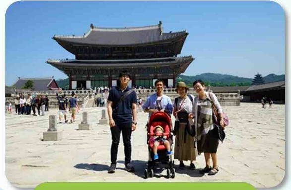
勤政殿の前で記念写真

朝鮮王朝を創始した太祖が1395年に正宮として創建された。5大王宮で最も面積が広く、建築が美しく鮮やかな色彩の装飾だった。約200年間栄えたが、1592年の豊臣秀吉の文禄の役の時期により全焼廃墟となった時代もあるものの、再建され現在は正殿や楼閣等が過去栄華を物語っていた。朝鮮時代に王宮で門の開閉や警備を担っていた「守門軍（スミングン）の交代の様子を再現した「王宮守門将交代儀式」では華やかななかにも格高い儀式を見学することができた。