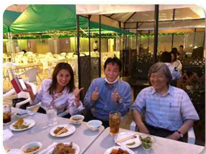
賛助会会長を挟んでイエーイ！

まだ沈まない太陽に照らされたビルの屋上で納涼会を催しました。 今日から夏休み。子供達の走り回る声が聞こえて来ます。 何だか遊園地の屋上のような気分でした。