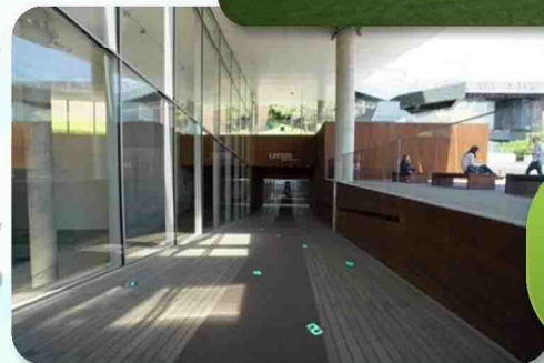
サムスン児童教育文化センターのエントランス