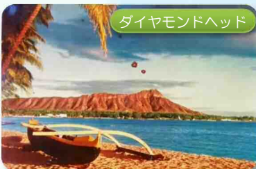
ダイヤモンドヘッド