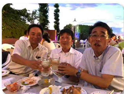
仲良し3人組で乾杯！