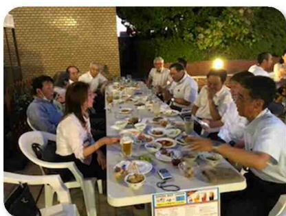
納涼会風景。皆さん思い思いに楽しんでいらっしゃいました。